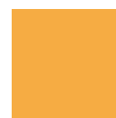
Mostaza RAL 1032