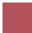
Rojo RAL 3003