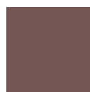
Chocolate RAL 8019