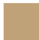
Visón RAL 1019